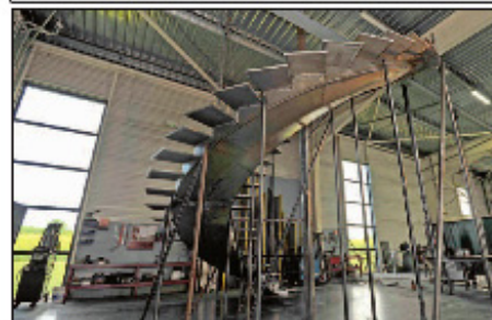
L'escalier ici en construction dans les ateliers craonnais.