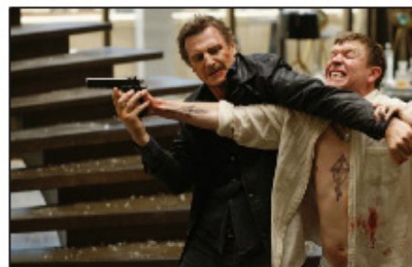
Liam Neeson devant l'escalier de REM (Crédit : Taken).

Les créations de la société REM (dont une partie des bureaux est située à Clichy-sous-Bois) sont fabriquées à Craon. Elles partent ensuite ornées de nombreux bâtiments importants : la Bourse, la Géode, à la télévision (I-télé, Canal+) etc. De grandes collectivités ou services publics, mais aussi des laboratoires pharmaceutiques ou entreprises, et même récemment un milliardaire propriétaire d'une île ont déjà fait appel à leurs services. C'est aujourd'hui le cinéma qui les sollicite.